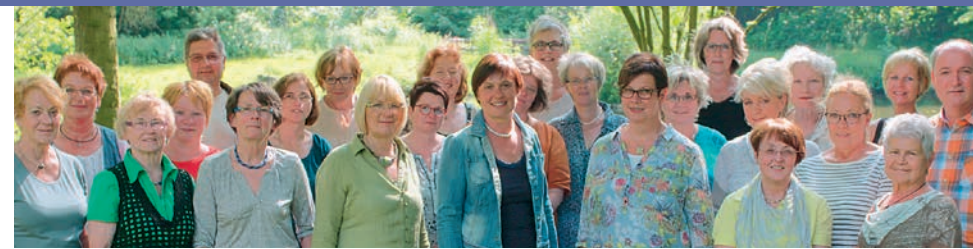
Ehrenamtliche und hauptamtliche MitarbeiterInnen