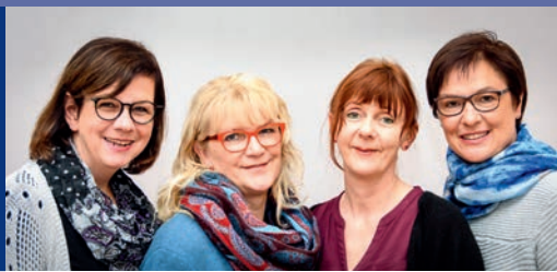
Die Koordinatorinnen des Ambulanten Hospizdienstes

Wir möchten Menschen in ihrem Wunsch unterstützen, ihre letzte Lebenszeit möglichst selbstbestimmt in ver- trauter Umgebung zu verbringen.